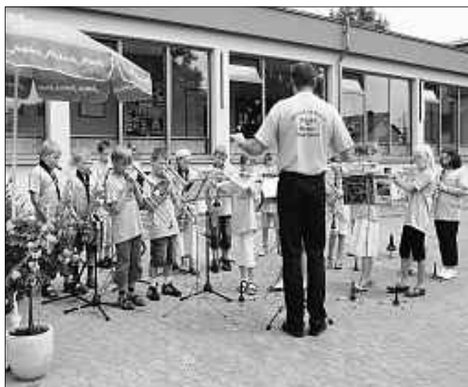
(Einweihungsfeier des Schulgebäudes nach der Sanierung im Juli 2010)

Rechtzeitig zur Schuleinweihung nach der Sanierung des Schulgebäudes konnten die Bläserklassenkinder die schönen einheitlichen T-Shirt`s mit einem Bläserklassenaufdruck in Empfang nehmen und der erste öffentliche Auftritt damit bravourös gemeistert werden.